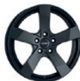
Dezent TD dark